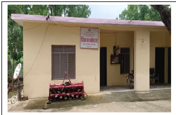
रंगपुर सब डि.व.का.