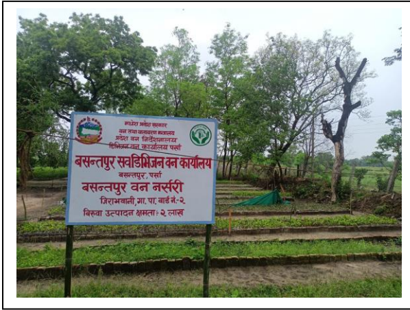
वसन्तपुर वन नर्सरी