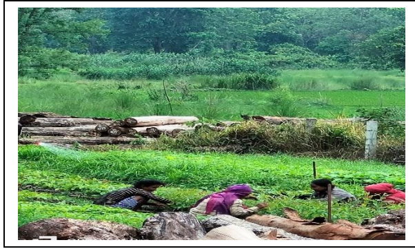
मनवा वन नर्सरी