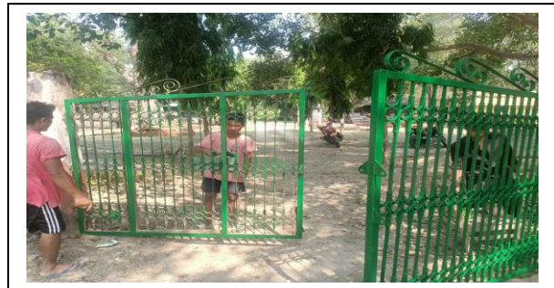
बढनिहार सब डि.व.का.