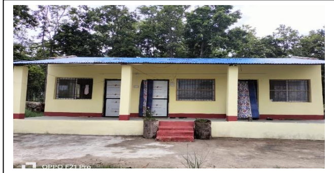
मनवा सब डि.व.का.

१९) डिभिजन वन कार्यालय भवन तथा सब डि.व.का भवन स्तरोन्नति :- यस शीर्षकमा चालु आ.व.मा रु.२९,८०,०००।- विनियोजन भएकोमा यस जिल्लाको वसन्तपुर सब डि.व.का., बढनिहार सब डि.व.का., रंगपुर सब डि.व.का.को भवन मर्मत र स्तरोन्नति कार्य भएको छ जसमा रु.२९,८०,०००।- खर्च भएको छ ।