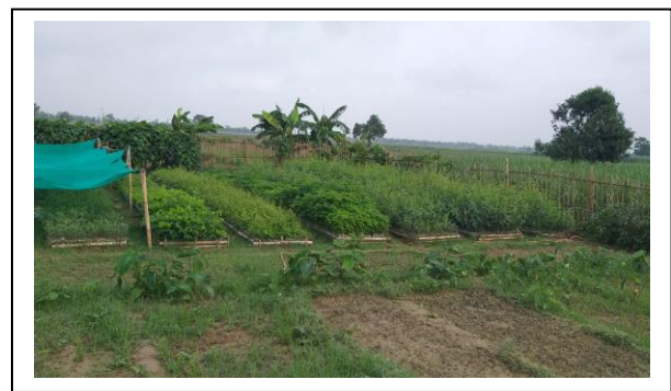
मिर्जापुर वन नर्सरी