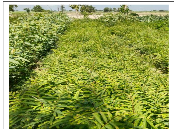
तुलसीवर्वा वन नर्सरी