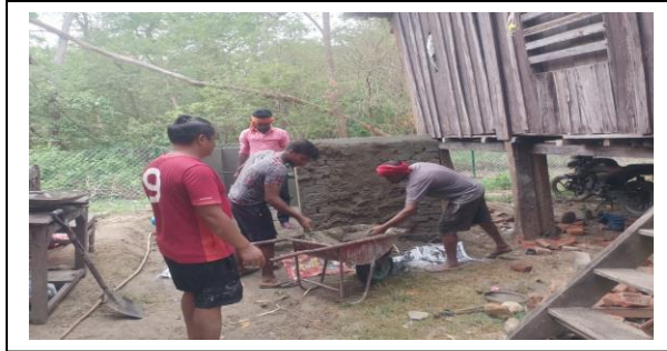
बढनिहार सब डि.व.का.

१९) डिभिजन वन कार्यालय भवन तथा सब डि.व.का भवन स्तरोन्नति :- यस शीर्षकमा चालु आ.व.मा रु.२९,८०,०००।- विनियोजन भएकोमा यस जिल्लाको वसन्तपुर सब डि.व.का., बढनिहार सब डि.व.का., रंगपुर सब डि.व.का.को भवन मर्मत र स्तरोन्नति कार्य भएको छ जसमा रु.२९,८०,०००।- खर्च भएको छ ।