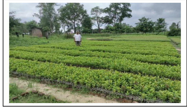
पोखरिया वन नर्सरी