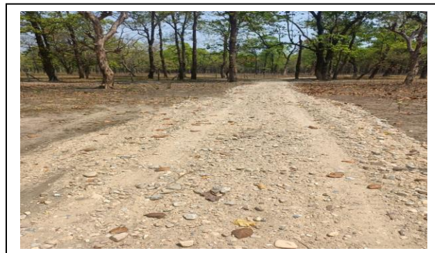
वसन्तपुर सव डि.व.का. क्षेत्र

८) प्रदेश हरित अभियान कार्यक्रम अन्तर्गत हुलाकी सडक लगायत जिल्लाको प्रमुख सडकको किनारमा वृक्षारोपण संरक्षण र रेखदेख:- यस शीर्षकमा चालु आ.व.मा रु. ३० लाख विनियोजन भएकोमा यस जिल्लाको पोखरिया नपा वडा नं.१० स्थित सडक किनारमा १२०० ट्रि गार्डसहित वृक्षारोपण गरिएको छ जसमा रु.२९,२०,८२४।- खर्च भएको छ ।