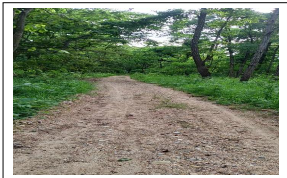
रंगपुर सव डि.व.का. क्षेत्र

७) वनपथ स्तरोन्नति सुधार कार्यक्रम:- यस शीर्षकमा चालु आ.व.मा रु.१५ लाख विनियोजन भएकोमा यस जिल्लाको रंगपुर सव डि.व.का वन क्षेत्रमा ७ कि.मी. र वसन्तपुर सव डि.व.का. वन क्षेत्रमा ८ कि.मी. स्तरोन्नतिको काम गरिएको छ जसमा रु.१५ लाख खर्च भएको छ ।