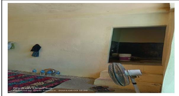
सशस्त्र वन सुरक्षा शाखाको थुनुवा कोठा

१८) कार्यालय तथा सब डिभिजन कार्यालय मर्मतसम्भार :- यस शीर्षकमा चालु आ.व.मा रु.२४ लाख विनियोजन भएकोमा यस जिल्ला अन्तर्गत रहेको मनवा सब डि.व.का., छतिवन टाँडीको चेकपोष्ट, डि.व.का. सशस्त्र वन सुरक्षा शाखाको मर्मत सम्भार कार्यमा रु.१६,९९,६२२।- खर्च भएको छ ।