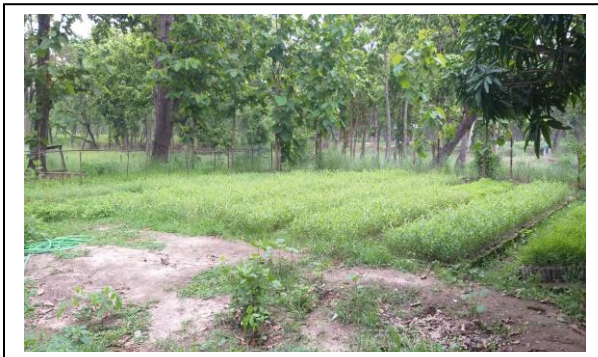
रंगपुर वन नर्सरी