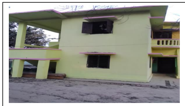
वसन्तपुर सब डि.व.का.