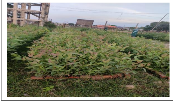
चिनी मिल वन नर्सरी