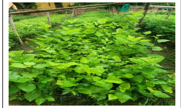
बढनिहार वन नर्सरी

१४) २ वर्षे बिरुवा उत्पादन, संरक्षण र व्यवस्थापन:- यस शीर्षकमा चालु आ.व.मा रु.२२ लाख विनियोजन भएकोमा यस जिल्लाको चिनी मिल वन नर्सरीमा उत्पादन गरी वितरण गर्न बाँकी रहेको छ जसमा रु.२१,९९,९७१।- खर्च भएको छ ।