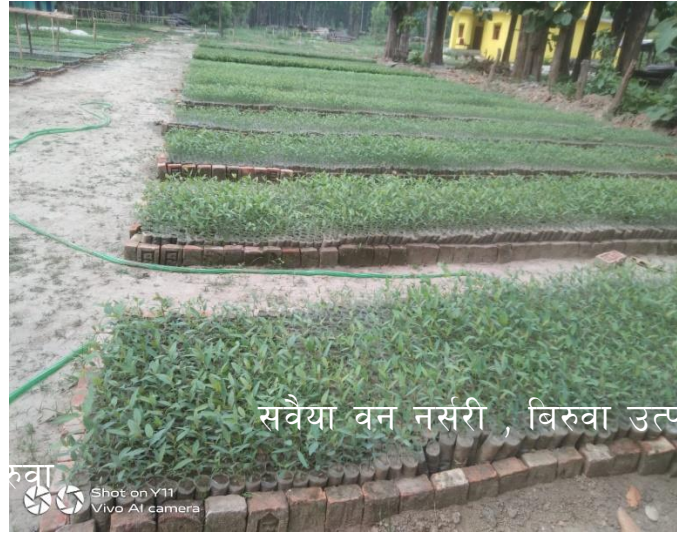
सवैया वन नर्सरी, विरवा उत्पादन