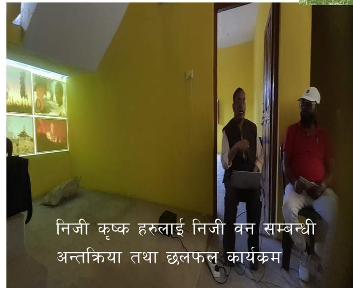
निजी कृषक हरुलाई निजी वन सम्बन्धी अन्तक्रिया तथा छलफल कार्यक्रम