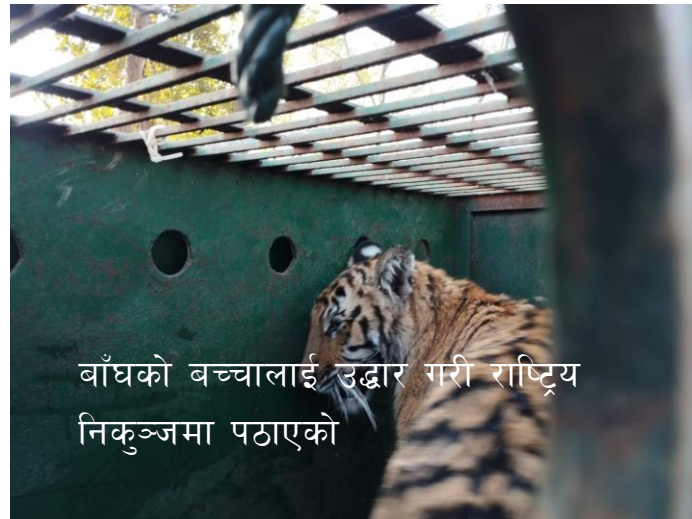
बाँघको बच्चालाई उद्धार गरी राष्ट्रिय निकुञ्जमा पठाएको